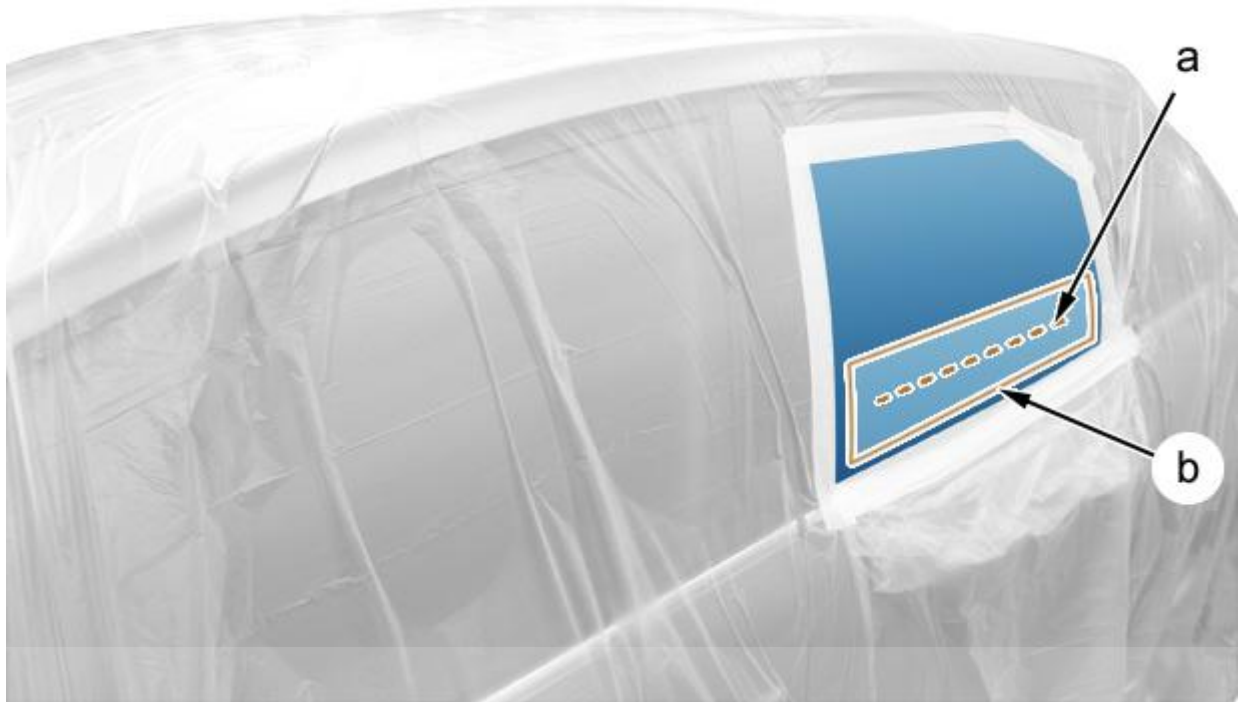
تصویر C5CM097D :