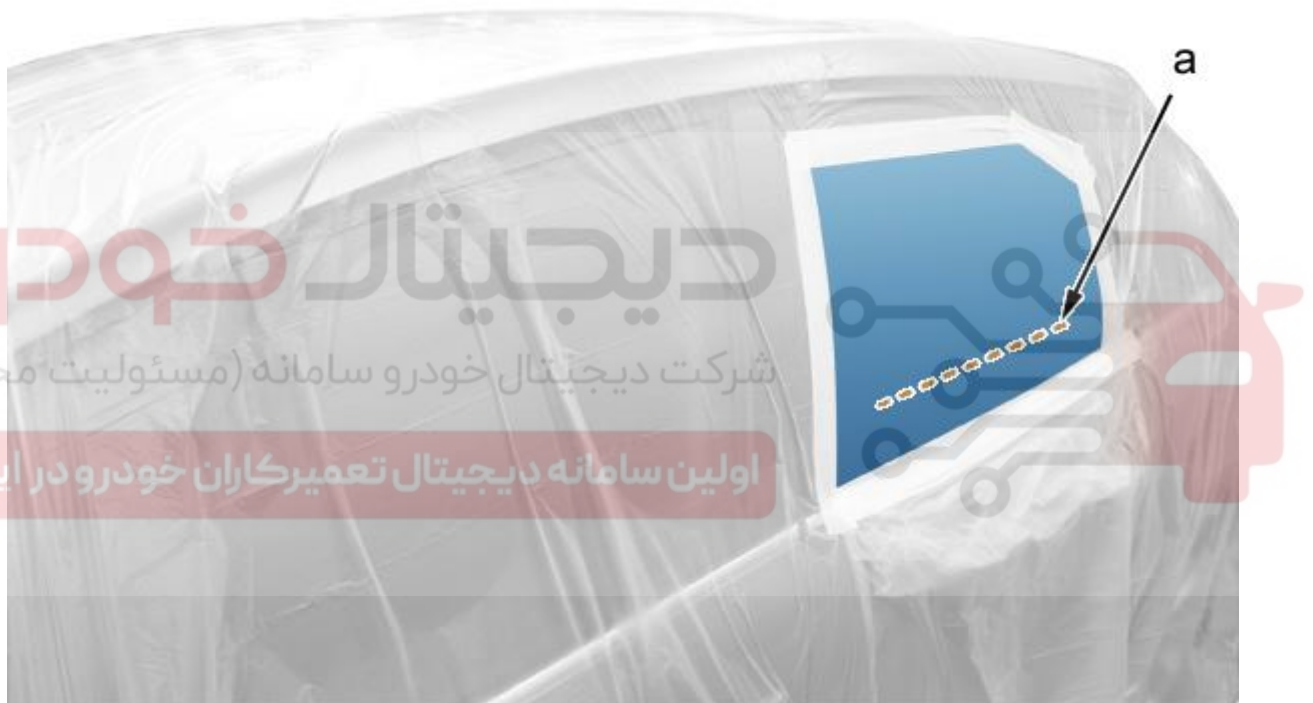
تصویر C5CM096D :

خراش (در نقطه a) را برای تعمیر شدن و تعیین تعمیر آن بررسی کنید.